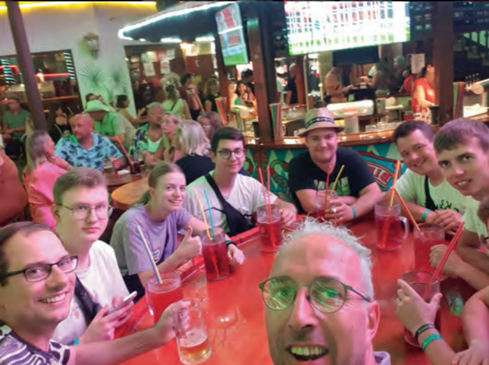
▲ im Bierkönig ▼ spanische Tapas