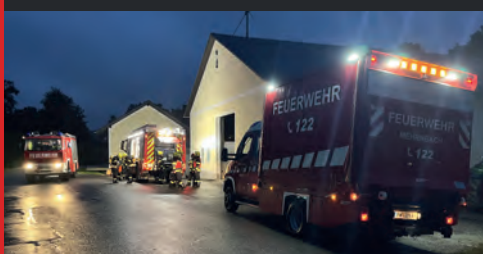
TLF-B Gerätekunde und Wasserw. ▶ ▼ Übung Personenrettung Aubach

Für eine Vereinbarung kontaktieren Sie uns per Telefon oder E-Mail an 08115@ri.ooelfv.at