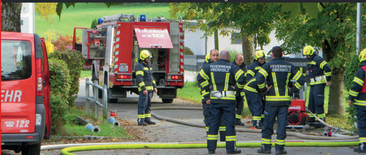
▼ Herbstübung Volksschulbrand, Saugstelle Wimbauer