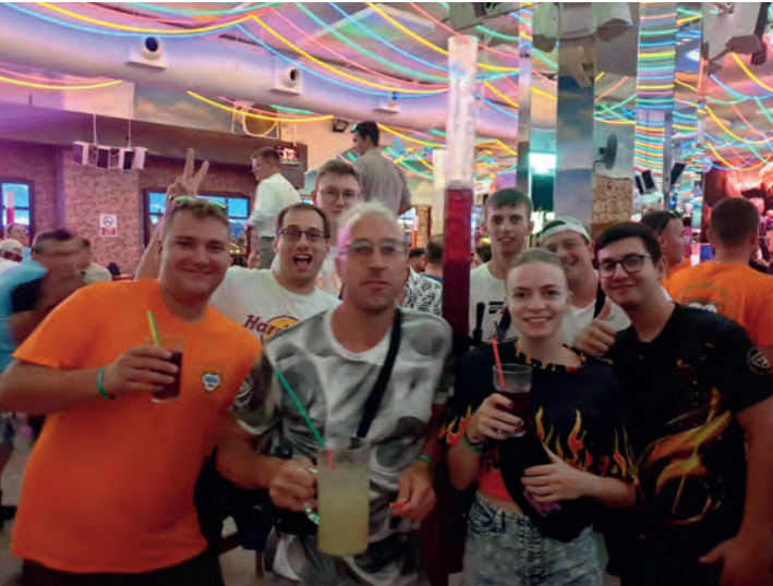
▲ im Megapark ▼ nächtliche Playa de Palma

Zum Abschluss der Bewerbungssaison ging es für einige Kamerad*innen der Bewerbungsgruppe hoch hinaus. Vom Flughafen München flogen wir am 18. September mit einem A321 von Condor Airlines nach Palma de Mallorca. Vier Tage hatten wir die Gelegenheit, die Playa zu erkunden. Die gute Lage des Hotels ermöglichte uns einen kurzen Fußweg an den Balneario 5, besser bekannt als "Ballermann". In den berühmten Lokalen Bierkönig und Megapark feierten wir in die Nacht hinein. Bei Höchsttemperaturen von 30° Celsius war auch baden im Meer problemlos möglich. Sight-Seeing in Palma Stadt, von der Basilica de Santa Maria de Mallorca, Placa Major bis zum Hafen von Palma und ein Besuch im Aquarium standen natürlich auch am Programm.