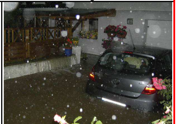
Eine überschwemmte Garageneinfahrt