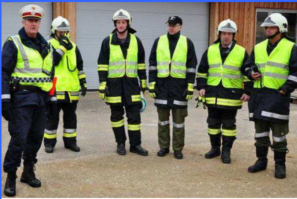
Beim Verkehrsreglerlehrgang in Auroldmünster nahmen 6 Kameraden teil. 19. November 2011