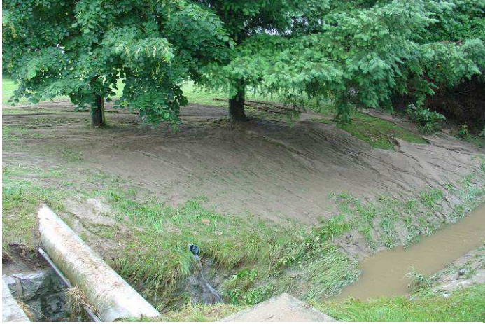
Der aus den Ufern getretene Mehrnbach