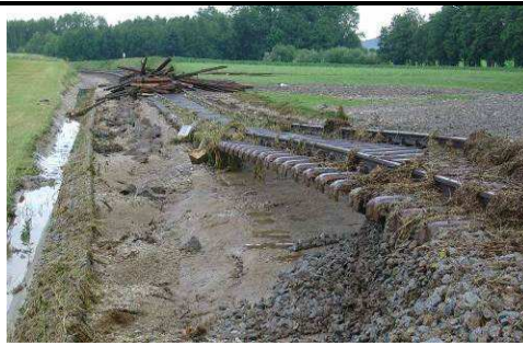
Die unterspülte Bahnstrecke in Abstätten und Atzing