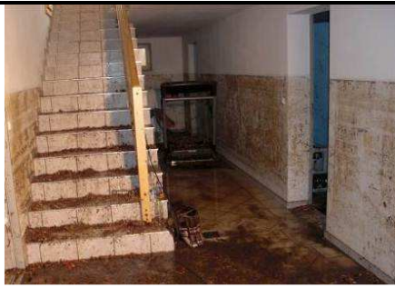
Ein überfluteter Keller