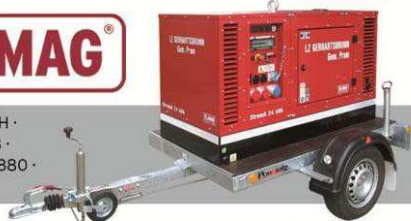
Bild: Stromerzeuger auf Fahrgestell 24 kVA, superschallgedämmt der FF Gerhartsbrunn

ELMAG Entwicklungs- und Handels-GmbH · A-4910 Ried im Innkreis · Hannesgrub 28 · Tel: +43-7752-80881 · Fax: +43-7752-80880 · e-mail: office@elmag.at