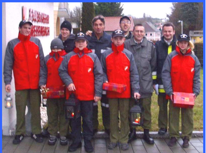
An der Friedenslichtaktion beteiligte sich auch im Vorjahr die Feuerwehrjugend . Begleitet wurden sie von einigen Feuerwehrkameraden.