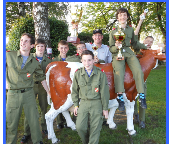
Abschnittsbewerb Ried Nord der FF Mettmach 2. Juni 2012