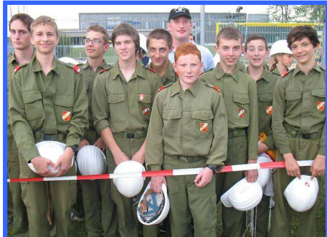
Landesbewerb Braunau 7. Juli 2012