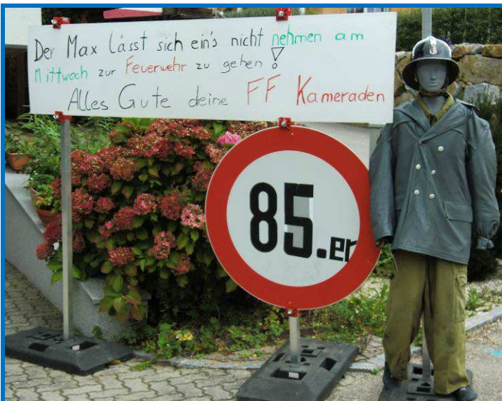
OBM Maximilian Böttinger feierte seinen 85. Geburtstag , dazu gratulierten die Kameraden mit einer Geburtstagsdarstellung. 22. September 2012