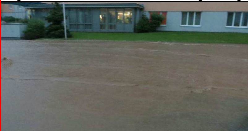
Die Fluten auf der Bundesstraße durch Mehrnbach

Das Funk- sowie das Handynetz waren wegen Überlastung zeitweise zusammengebrochen, was dazu führte, dass zwischen der Einsatzleitung und den eingesetzten Feuerwehren keine Nachrichtenverbindung mehr bestand wodurch ein koordiniertes Vorgehen fast unmöglich war. Zur Unterstützung der Mehrnbacher Feuerwehren wurden vom Bezirksfeuerwehrkommandanten weitere Feuerwehren (Oberberg, Reichersberg, Antiesenhofen, Stelzham) in unseren Pflichtbereich beordert. Die Pumparbeiten dauerten bis in die frühen Morgenstunden. Auch am nächsten Tag waren die Feuerwehren damit beschäftigt, die ärgsten Schäden zu beseitigen.