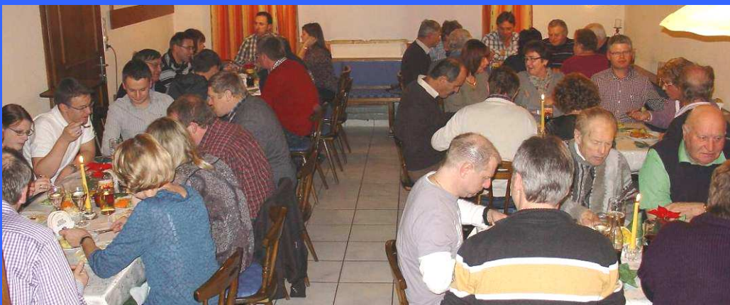
Bei der Weihnachtsfeier war es gesellig und der Jahresrückblick interessant.