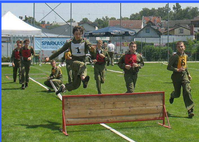
Bezirksbewerb der FF Ried 30. Juni 2012