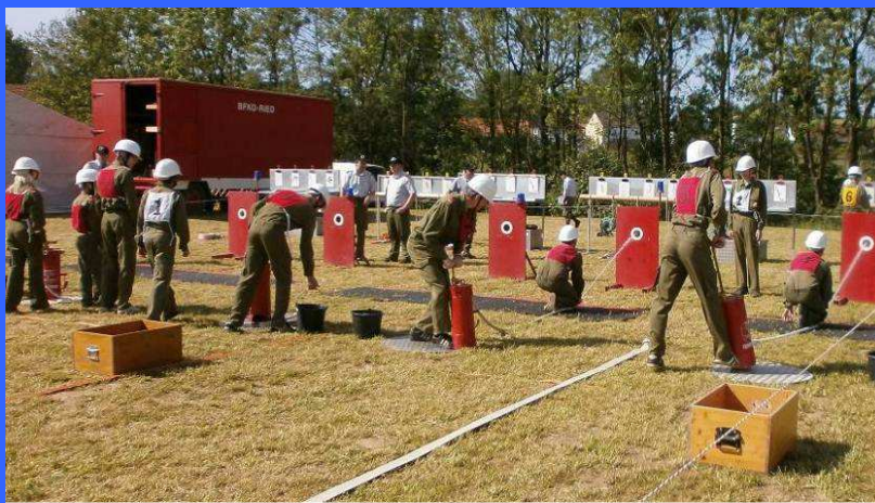
Abschnittsbewerb Obernberg der FF Traxlham, Gemeinde Reichersberg 19. Mai 2012