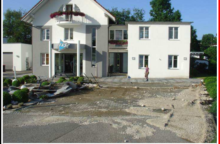
Einer von etlichen betroffenen Betrieben

Die FF Mehrnbach war mit 20 Mann dem TLF, dem LFB und dem KDO im Einsatz.