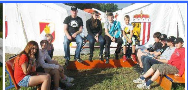
Jugendlager in Taufkirchen an der Pram 12. – 18. Juli 2012