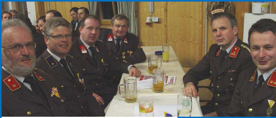
Eine Abordnung von Kameraden besuchte die Bezirksfeuerwehrtagung in der Bauernmarkthalle. Dabei wurden 2 Kameraden geehrt.