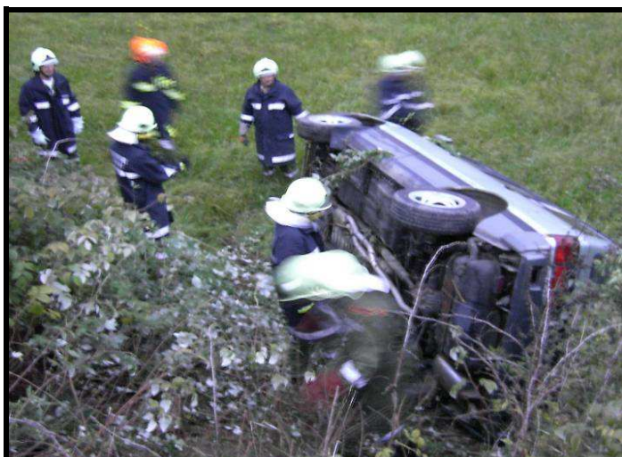
Gemeinsame technische Übung mit der FF Asenham am Bergerweg 12. September 2007