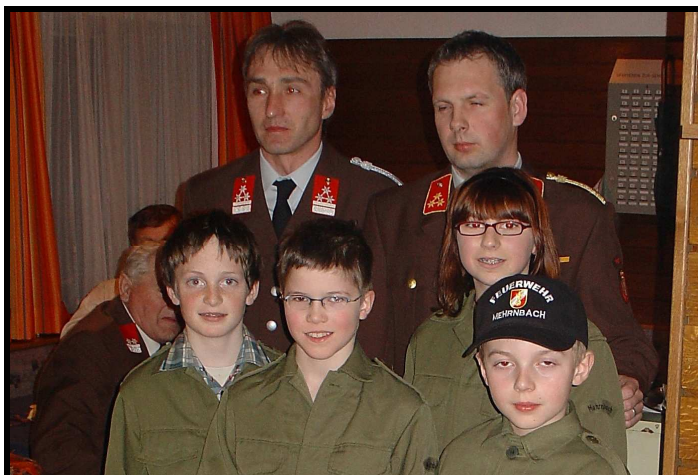
Die erprobte Jugendgruppe anlässlich der Jahreshauptversammlung 23. März 2007