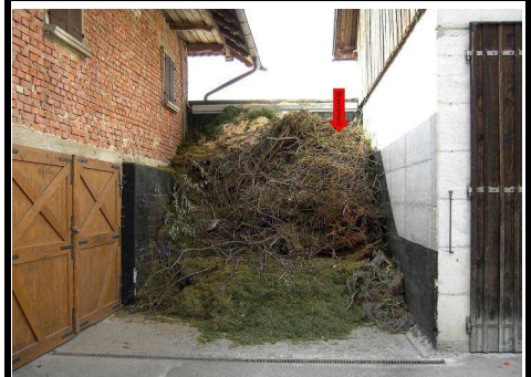
Grünschnittbox im ASI Entstehungsbrand durch Asche