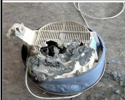
Trockenhaubenbrand im Seniorenwohnheim