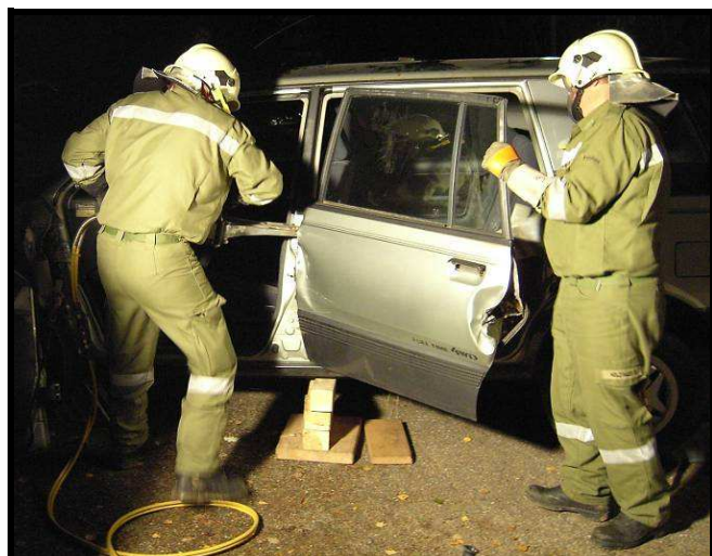
Gemeinsame Bergeübung mit der FF Asenham an einem Pkw. 12. September 2007