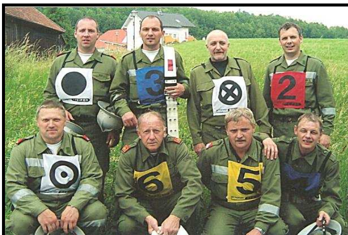
Die heurige Bewerbsgruppe Asenham-Mehrnbach Juni - Juli 2007