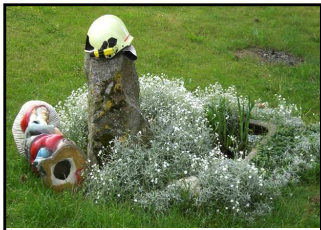
Warf der Anblick des Feuerwehrhelmes selbst den Gartenzwerg um?