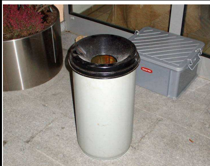
Sicherheitseimerbrand im Seniorenwohnheim